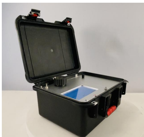
图 1 仪器外形图